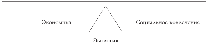
Рис. 1 Прежний треугольник развития

развития (экономические отношения + социальное вовлечение + экология), разработанном в конце 1980-х годов (базовым документом стал отчет Комиссии Брунтланд 12 ), успешно закрепленном в 1990-е и используемом сегодня в местных, национальных и глобальных стратегиях развития в качестве образца для анализа и деятельности государственной власти. К примеру, Лиссабонская программа 13 , содержащая политические принципы развития Европейского Союза до 2010 года, опирается на этот благотворный треугольник.