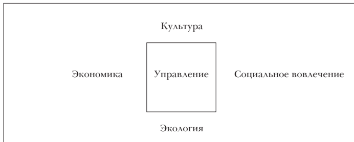
Рис. 2. Новый квадрат развития

жизнеспособность, и если культура присутствует во всех человеческих инициативах, необходим инструмент, чтобы убедиться, что вся деятельность государственной власти оценивается с культурной перспективы» 14 .